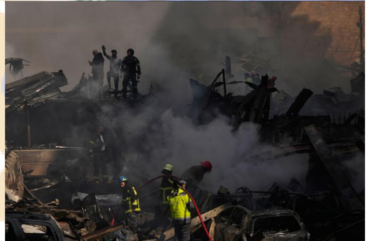
Ảnh: Lực lượng cứu hộ tại hiện trường một tòa nhà đổ nát sau đòn tập kích của Israel vào Beirut, Lebanon ngày 08/04

Nhà đầu tư không chủ quan khi các diễn biến của cuộc xung đột có thể thay đổi rất nhanh, tác động lên giá dầu, và khiến tâm lý thị trường bị ảnh hưởng.