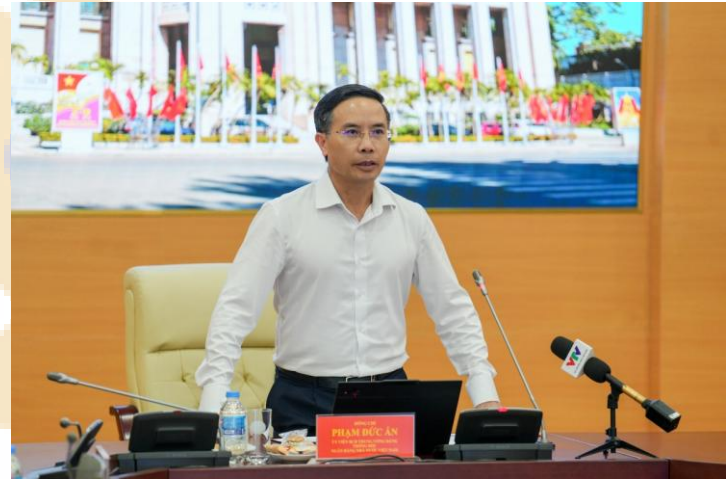
Ảnh: Đồng chí Phạm Đức Ân - Ủy viên BCH Trung ương Đảng, Thống đốc Ngân hàng Nhà nước chủ trì cuộc họp

Đây là tín hiệu tích cực đầu tiên về việc nới lỏng chính sách tiền tệ để hỗ trợ kinh tế sau khi kiện toàn bộ máy mới. Thông tin này tác động tích cực lên tâm lý thị trường.