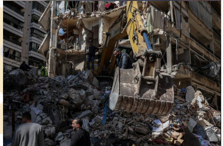
Ảnh: Các lực lượng cứu hộ đang hoạt động tại hiện trường vụ không kích do Israel thực hiện vào ngày thứ Tư, tại khu Ain Al Mraiseh, Beirut, Lebanon, ngày 09/04/2026

Giá dầu hiện tại chưa có xu hướng rõ ràng, và dễ biến động theo triển vọng của việc đàm phán hòa bình giữa các bên trong cuộc xung đột tại Trung Đông. Do đó, nhà đầu tư cần thận trọng khi những biến động mạnh của giá dầu hoàn toàn có thể xảy ra và tác động tiêu cực lên tâm lý thị trường.