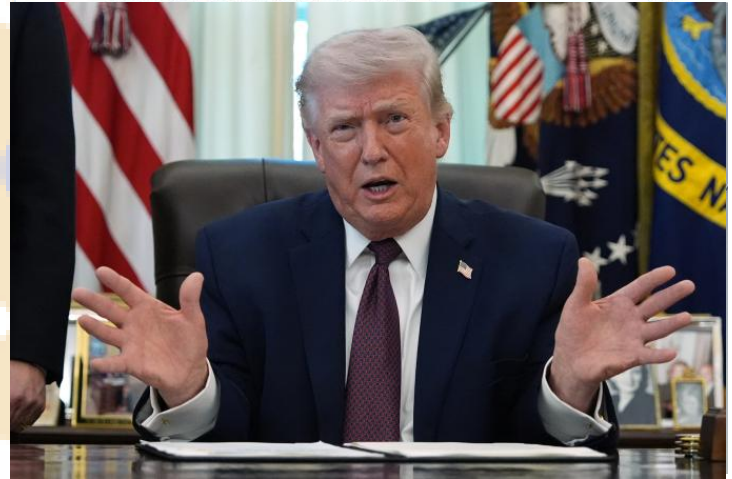
Ảnh: Tổng thống Mỹ Donald Trump tại Nhà Trắng ngày 31/03/2026

Thông tin đang diễn biến theo hướng tích cực. Thông tin này có lợi cho hầu hết các cổ phiếu và thị trường chung. Chúng tôi lưu ý nhóm dầu khí và phân đạm tiếp tục chịu áp lực trước quán tính thông tin hiện tại. Mặc dù được hưởng lợi, các cổ phiếu 2 nhóm này đang có định giá quá cao so với tiềm năng có thể nhận được.