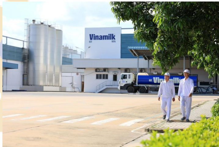
Ảnh: Minh họa

Mức tăng trưởng theo kế hoạch của VNM thấp hơn nhiều so với mức tăng trưởng chung dự kiến của nền kinh tế (8-10%), trong đó một phần phản ánh sự bão hòa của ngành sữa Việt Nam. Chúng tôi không ưu tiên cổ phiếu VNM trong giai đoạn 2026-2028.