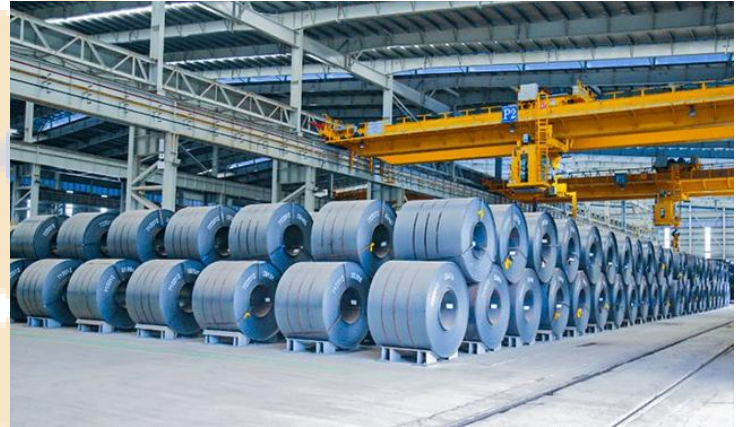
Ảnh: Minh họa

Tích cực. Biện pháp áp thuế giúp bảo vệ ngành thép trong nước trước áp lực cạnh tranh từ hàng nhập khẩu lẩn tránh. Tác động tích cực mạnh cho Hòa Phát (HOSE: HPG) và Formosa. Ngoài ra, các doanh nghiệp ống thép và tôn mạ với lượng hàng tồn kho cao như Hòa Sen (HOSE: HSG) và Nam Kim (HOSE: NKG) cũng có thể hưởng lợi trong ngắn hạn. Tuy nhiên, nhà đầu tư cần lưu ý rằng các doanh nghiệp này về trung-dài hạn sẽ gặp bất lợi bởi chi phí đầu vào gia tăng.