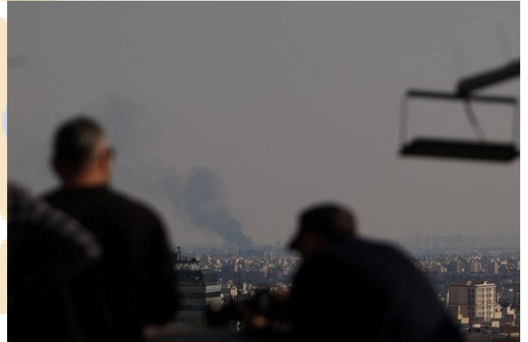
Ảnh: Khói bốc lên sau một đòn tấn công, trong bối cảnh xung đột Mỹ – Israel với Iran, tại Tehran (Iran), ngày 01/04/2026.

Đây là diễn biến bất lợi và đi ngược lại với kỳ vọng trước đó. Trước sự bất định của thông tin trong giai đoạn này, chúng tôi khuyến khích nhà đầu tư nên duy trì tỷ trọng vừa phải cho danh mục.