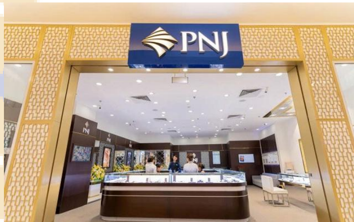
Ảnh: Minh họa