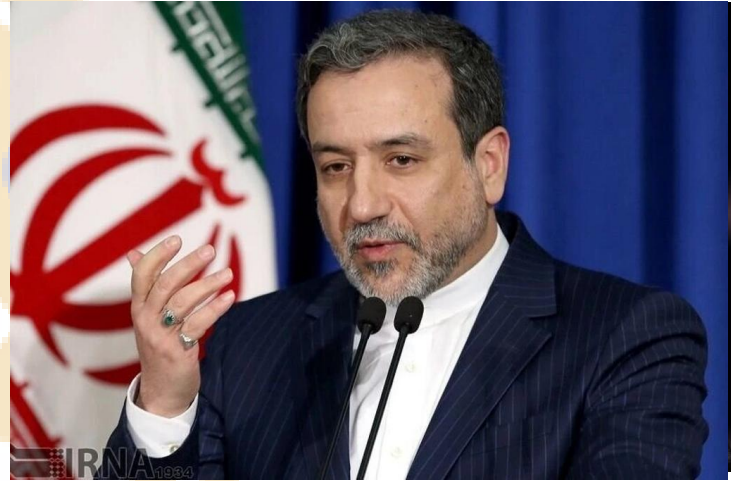
Ảnh: Ngoại trưởng Iran Abbas Araghchi

Đây là thông tin tích cực cho thấy các bên có xu hướng nhượng bộ để đàm phán thay vì tiếp tục đẩy chiến sự leo thang. Mặc dù triển vọng kết thúc chiến tranh là chưa chắc chắn, song việc giá dầu hạ nhiệt phần nào giúp tâm lý thị trường ổn định hơn.