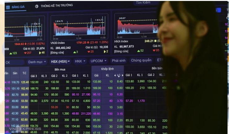
Ảnh: Minh họa

Đây là nấc thang mới cho TTCK Việt Nam, giúp thị trường thu hút thêm các dòng vốn trên thế giới. Thông tin tích cực và mang những lợi ích về trung – dài hạn cho TTCK Việt Nam. Trong ngắn hạn, thông tin này tích cực về mặt tâm lý. Chúng tôi cho rằng, dòng vốn các quỹ ETF tham gia vào sẽ giải ngân theo lộ trình trong 1 năm, kể từ tháng 9/2026 sẽ ít tác động tới giá cổ phiếu trong rõ. Bên cạnh đó, chúng tôi kỳ vọng sớm có các quỹ chủ động tham gia vào thị trường.