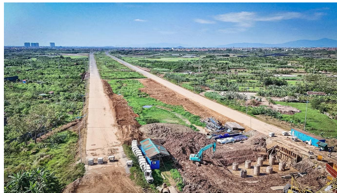
Dự án Đường Vành đai 4 đang được đẩy nhanh tiến độ thi công nhằm sớm thông xe, phục vụ nhu cầu đi lại của người dân.

Việc Vành đai 4 tăng tốc triển khai cho thấy quyết tâm đẩy mạnh đầu tư hạ tầng chiến lược trước thềm APEC 2027, đồng thời tạo động lực lớn cho kết nối vùng và sự phát triển của các đô thị vệ tinh quanh Hà Nội. Dự án tiếp tục phản ánh tốc độ triển khai hạ tầng ở mức cao dưới định hướng thúc đẩy đầu tư công của Chính phủ. Đây được xem là yếu tố hỗ trợ tích cực đối với nhu cầu vật liệu xây dựng cũng như nhóm doanh nghiệp hạ tầng trong trung hạn.