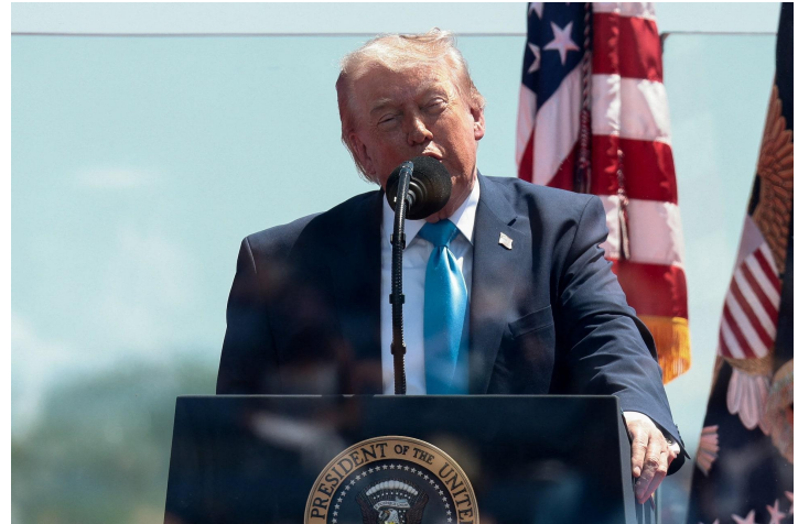
Tổng thống Mỹ Donald Trump đứng sau lớp kính bảo vệ khi ông phát biểu tại lễ tốt nghiệp Học viện Cảnh sát biển Mỹ ở New London, Connecticut, Mỹ, ngày 20 tháng 5 năm 2026.

Diễn biến mới cho thấy thị trường dầu đang chuyển từ trạng thái định giá rủi ro chiến sự sang kỳ vọng phục hồi nguồn cung nếu Mỹ và Iran đạt thỏa thuận. Tuy nhiên, mặt bằng giá dầu vẫn duy trì cao do gián đoạn logistics tại Hormuz chưa được giải quyết hoàn toàn và nguồn cung vật chất cần thời gian dài để phục hồi. Điều này tiếp tục tạo áp lực lên lạm phát năng lượng toàn cầu và duy trì biến động mạnh với nhóm cổ phiếu dầu khí, vận tải và hóa chất trong ngắn hạn.