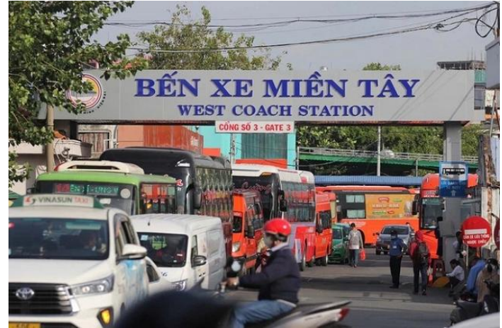
Bến xe Miền Tây tại đường Kinh Dương Vương, Phường An Lạc, TPHCM.

Kế hoạch đi ngang cho thấy Bến xe Miền Tây đang chuyển sang trạng thái phòng thủ khi nhu cầu vận tải hành khách chịu áp lực từ giá nhiên liệu và biến động kinh tế. Tuy nhiên, việc đầu tư trạm sạc điện cho thấy doanh nghiệp bắt đầu chuẩn bị cho xu hướng chuyển đổi sang xe điện trong lĩnh vực vận tải. Trong trung hạn, triển vọng ngành vẫn phụ thuộc lớn vào sức phục hồi tiêu dùng, du lịch nội địa và chi phí nhiên liệu.