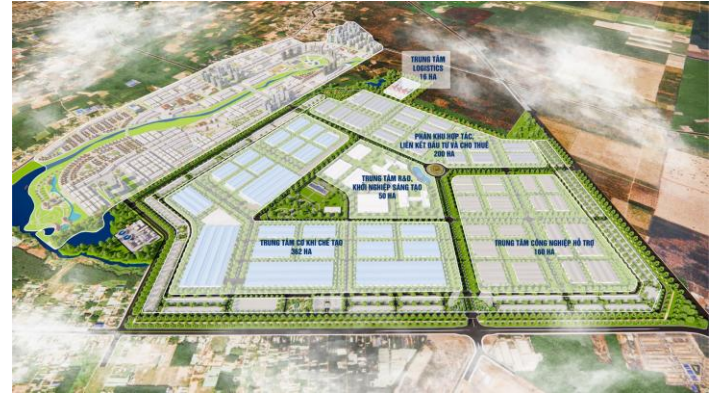
Phối cảnh Khu công nghiệp chuyên ngành cơ khí 786 ha của THACO tại TP.HCM, dự kiến vận hành từ tháng 9/2026, chuyên sản xuất đầu máy – toa tàu, thiết bị nhà ga và sản phẩm công nghiệp nặng

PHR tiếp tục là doanh nghiệp hưởng lợi rõ nét từ xu hướng chuyển đổi đất cao su sang khu công nghiệp tại Bình Dương cũ, trong bối cảnh nhu cầu phát triển công nghiệp và hạ tầng khu vực phía Nam tăng mạnh. Dòng tiền đền bù lớn giúp doanh nghiệp cải thiện lợi nhuận và nguồn lực tài chính trong ngắn hạn, dù tính ổn định không cao do phụ thuộc tiến độ pháp lý và bàn giao đất. Về dài hạn, chiến lược mở rộng sang khu công nghiệp và năng lượng tái tạo có thể giúp PHR giảm dần sự phụ thuộc vào chu kỳ giá cao su.