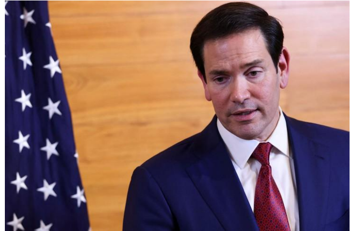
Ngoại trưởng Mỹ Marco Rubio

Diễn biến giá dầu cho thấy thị trường hiện nhạy cảm hơn với tín hiệu ngoại giao thay vì chỉ phản ứng với rủi ro quân sự. Mặt bằng giá dầu vẫn duy trì ở mức cao do nguồn cung toàn cầu còn thiếu hụt và căng thẳng tại Trung Đông chưa thực sự được giải quyết. Điều này tiếp tục tạo áp lực lên lạm phát, chi phí vận tải và chính sách tiền tệ toàn cầu. Chúng tôi cho rằng, trong bối cảnh thị trường đang ở giai đoạn trống thông tin như hiện tại, giá dầu vượt khỏi biên 90-120 USD/thùng sẽ tác động lên tâm lý chung.