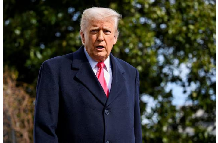
Tổng thống Donald Trump.

Tuyên bố mới của ông Trump cho thấy Mỹ đang hạ kỳ vọng về khả năng sớm đạt thỏa thuận với Iran, đồng thời duy trì áp lực địa chính trị lên thị trường năng lượng. Điều này khiến rủi ro gián đoạn nguồn cung dầu tiếp tục hiện hữu, qua đó duy trì mặt bằng giá dầu ở mức cao. Chúng tôi cho rằng, thị trường tài chính toàn cầu đã quen với trạng thái "bình thường mới" của giá dầu cao. Trường hợp giá dầu vượt ra khỏi vùng biên 90-120 USD/thùng có thể tác động đến tâm lý chung theo cả 2 hướng khi các thông tin về kết quả kinh doanh chưa xuất hiện.