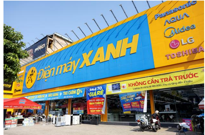
Mô hình bán lẻ hướng tới tối ưu giá trị trọn vòng đời khách hàng là chiến lược trọng tâm giúp Điện Máy Xanh thay đổi cách định giá trong mắt giới đầu tư

Thông tin IPO được đánh giá tích cực khi DMX đang chuyển từ mô hình bán lẻ truyền thống sang hệ sinh thái dịch vụ có khả năng tạo doanh thu định kỳ. Chất lượng tăng trưởng cải thiện khi biên lợi nhuận mở rộng cùng doanh thu chưa thực hiện tăng mạnh. Ngắn hạn, động lực đến từ chu kỳ nâng cấp thiết bị mới và tăng trưởng màng hậu mãi, tài chính tiêu dùng. Tuy nhiên, rủi ro chính vẫn nằm ở sức mua điện máy và khả năng duy trì tăng trưởng lợi nhuận sau giai đoạn tối ưu mạnh hệ thống cửa hàng.