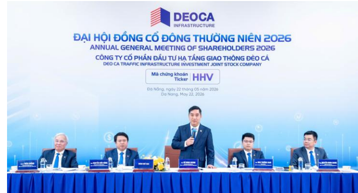
HHV tổ chức ĐHĐCĐ thường niên 2026 vào sáng ngày 22/05 theo hình thức trực tuyến.

Thông điệp đáng chú ý tại ĐHĐCĐ là HHV ưu tiên kiểm soát rủi ro và dòng tiền thay vì theo đuổi tăng trưởng bằng mọi giá. Việc chủ động rút khỏi các dự án có rủi ro pháp lý hoặc cơ chế tài chính chưa rõ ràng cho thấy chiến lược đầu tư thận trọng hơn trong bối cảnh chi phí vốn vẫn cao. Ngắn và trung hạn, động lực chính đến từ khả năng tháo gỡ cơ chế BOT và dòng tiền hỗ trợ khoảng 7,000 tỷ đồng cho các dự án hiện hữu. Nếu được giải ngân đúng tiến độ, áp lực tài chính của HHV sẽ giảm đáng kể, tạo dư địa mở rộng đầu tư các dự án hạ tầng quy mô lớn.