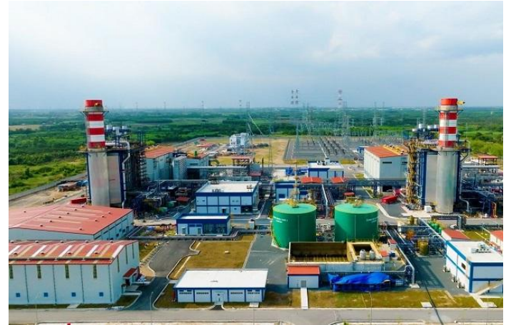
Nhà máy điện Nhơn Trạch 3&4

Kết quả 5 tháng cho thấy POW đang vượt xa kế hoạch lợi nhuận mang tính thận trọng ban đầu, phản ánh nhu cầu điện duy trì cao và điều kiện vận hành thuận lợi hơn dự kiến. Chất lượng tăng trưởng tương đối tích cực khi đến từ hoạt động cốt lõi thay vì yếu tố bất thường. Triển vọng ngắn hạn vẫn hỗ trợ bởi phụ tải điện tăng và khả năng điều chỉnh tăng tỷ lệ Qc, giúp cải thiện hiệu quả vận hành các nhà máy nhiệt điện khí. Rủi ro chính vẫn nằm ở biến động giá LNG, diễn biến thời tiết nửa cuối năm và áp lực xử lý dứt điểm phần khí trả trước còn lại tại Cà Mau 1&2.