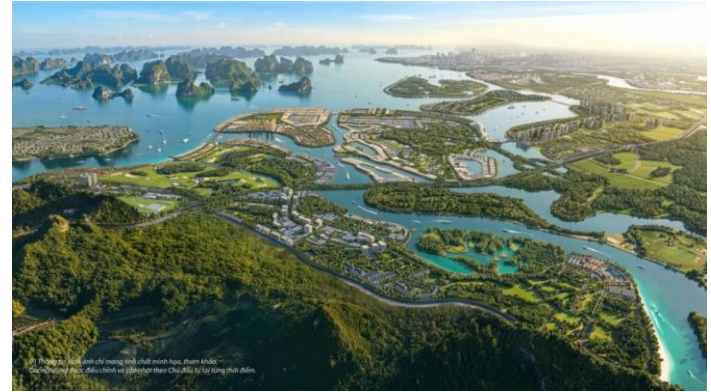
Phối cảnh dự án của Vinhomes Global Gate Hạ Long.

Động thái của Vinhomes phản ánh nỗ lực mở rộng nguồn cầu và khai thác dòng tài sản tích trữ trong dân trong bối cảnh thanh khoản bất động sản đang dần phục hồi. Điểm đáng chú ý là doanh nghiệp không chỉ bán sản phẩm mà còn xây dựng cơ chế bảo toàn giá trị tài sản theo vàng, qua đó giảm tâm lý phòng thủ của người mua nhà. Ngắn hạn, chương trình có thể hỗ trợ tốc độ hấp thụ tại các dự án cao cấp và cải thiện dòng tiền bán hàng. Tuy nhiên, hiệu quả thực tế sẽ phụ thuộc vào biến động giá vàng, mật bảng lãi suất và khả năng duy trì sức hấp dẫn của thị trường bất động sản trong trung hạn.