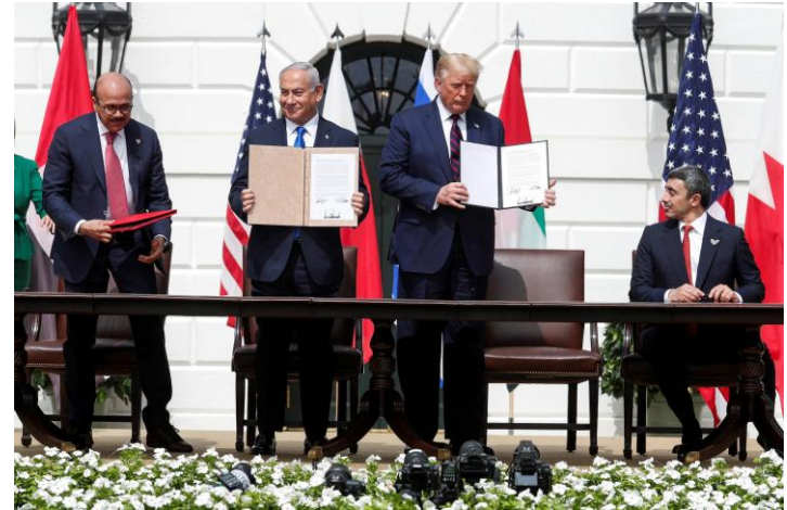
Ngoại trưởng Bahrain Abdullatif Al Zayani, Thủ tướng Israel Benjamin Netanyahu, Tổng thống Mỹ Donald Trump và Ngoại trưởng Các Tiểu vương quốc Ả Rập Thống nhất (UAE) Abdullah bin Zayed tham gia lễ ký kết Hiệp định Abraham, bình thường hóa quan hệ giữa Israel và một số nước láng giềng Trung Đông trong một bước đi chiến lược.

Động thái của ông Trump cho thấy Mỹ đang cố mở rộng khuôn khổ đàm phán Iran thành một cấu trúc địa chính trị lớn hơn tại Trung Đông. Tuy nhiên, khả năng đạt đồng thuận ngắn hạn là thấp khi chiến sự tại Gaza tiếp tục khiến quan hệ Israel và các quốc gia Hồi giáo trở nên nhạy cảm. Thị trường năng lượng vẫn chờ đợi tiến triển trong đàm phán giữa Mỹ - Iran. Rủi ro lớn nhất vẫn nằm ở khả năng đàm phán đổ vỡ hoặc căng thẳng quân sự tái leo thang, đẩy giá dầu biến động mạnh trở lại.