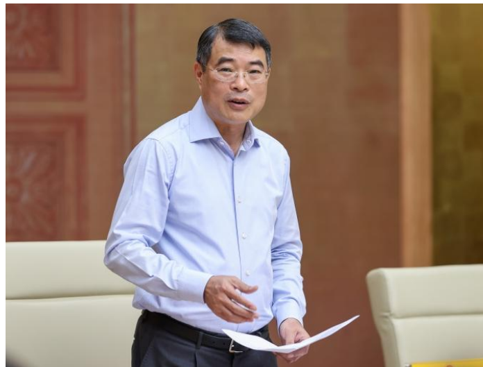
Thủ tướng Lê Minh Hưng chủ trì cuộc làm việc với UBND TP Hà Nội và các bộ, ngành về phát triển nhà ở cho thuê trên địa bàn Thủ đô.

Thông điệp từ Chính phủ cho thấy định hướng chính sách bất động sản đang dịch chuyển rõ hơn sang mô hình nhà ở cho thuê và nhà ở phục vụ nhu cầu thực thay vì chỉ tập trung phân khúc sở hữu. Đây là tín hiệu tích cực với nhóm doanh nghiệp có quỹ đất đô thị lớn, năng lực vận hành dài hạn và khả năng tham gia mô hình TOD hoặc nhà ở xã hội. Trong ngắn hạn, việc tác động lên lợi nhuận doanh nghiệp có thể chưa đáng kể do các dự án cần thời gian triển khai và hoàn thiện cơ chế pháp lý. Tuy nhiên, về trung hạn, đây có thể trở thành động lực mở rộng nguồn cầu và tạo thêm dư địa phát triển cho thị trường bất động sản đô thị.