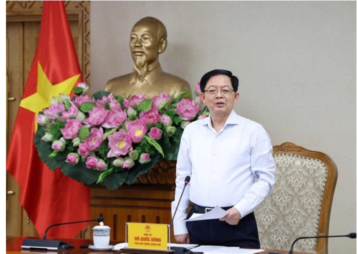
Phó Thủ tướng nhấn mạnh cần coi đất đai là một trong những nguồn lực quan trọng nhất để phát triển đất nước

Thông tin mang tính tích cực đối với nhóm bất động sản, khu công nghiệp và hạ tầng khi định hướng sửa Luật Đất đai tiếp tục nhấn mạnh mục tiêu tháo gỡ thủ tục và tối ưu hiệu quả sử dụng đất. Đây là yếu tố quan trọng giúp cải thiện tiến độ pháp lý dự án và khả năng triển khai đầu tư trong trung hạn. Tuy nhiên, tác động thực tế vẫn phụ thuộc vào mức độ sửa đổi cụ thể và tiến độ ban hành các nghị định hướng dẫn.