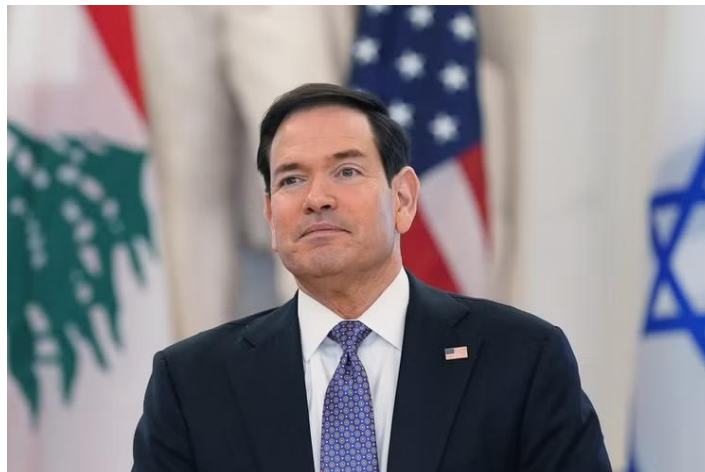
Ngoại trưởng Mỹ Marco Rubio.

Mặt bằng giá dầu quanh 100 USD/thùng tiếp tục hỗ trợ triển vọng ngắn hạn của nhóm doanh nghiệp thương mại và dịch vụ dầu khí. Thị trường vẫn chờ kết quả đàm phán Mỹ - Iran và khả năng duy trì lưu thông hàng hải tại Hormuz. Nếu căng thẳng hạ nhiệt, áp lực điều chỉnh giá dầu có thể xuất hiện trở lại sau giai đoạn tăng nóng trước đó.