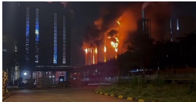
Nguồn lửa bùng lên dữ dội bên trong khu xưởng của nhà máy.

Phản ứng thị trường cho thấy nhà đầu tư đánh giá sự cố tại nhà máy Phú Mỹ chưa ảnh hưởng đáng kể tới hoạt động vận hành hay triển vọng tài chính của Hoa Sen Group. Điểm tích cực là khu vực xảy ra cháy không nằm trong dây chuyền sản xuất cốt lõi và tài sản đã được bảo hiểm đầy đủ. Ngắn hạn, tác động tới kết quả kinh doanh nhiều khả năng ở mức hạn chế nếu hoạt động sản xuất duy trì ổn định. Tuy nhiên, doanh nghiệp vẫn đối mặt rủi ro phát sinh chi phí sửa chữa, gián đoạn cục bộ hoặc yêu cầu siết chặt tiêu chuẩn an toàn vận hành trong thời gian tới.