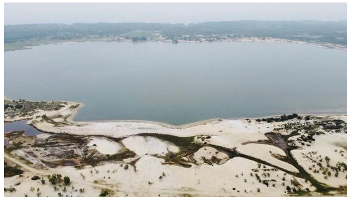
Toàn cảnh mỏ sắt Thạch Khê nhìn từ trên cao

Quặng sắt chiếm khoảng 30% chi phí đầu vào của HPG. Đây là thông tin tích cực về dài hạn khi HPG đẩy mạnh chiến lược tự chủ một phần nguyên liệu đầu vào. Trong ĐHCĐ 2026, BLĐ HPG chia sẻ về dài hạn, nguyên liệu đầu vào của HPG vẫn chủ yếu đến từ nhập khẩu, cụ thể từ Úc. Rủi ro chính đến từ chi phí đầu tư lớn và yêu cầu môi trường cao.