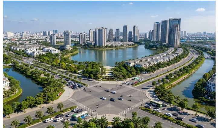
Phối cảnh Khu đô thị đa mục tiêu xã Thư Lâm và Đông Anh.

Quy định hạn chế chuyển nhượng 3 năm cho thấy Thành phố Hà Nội đang ưu tiên kiểm soát đầu cơ và thúc đẩy nhu cầu ở thực tại các khu đô thị chiến lược. Điều này có thể làm giảm thanh khoản đầu cơ ngắn hạn nhưng hỗ trợ tính ổn định và chất lượng thị trường về dài hạn. Mô hình đô thị đa mục tiêu gắn với TOD và hạ tầng đồng bộ cũng mở ra dư địa tăng trưởng mới cho nhóm doanh nghiệp phát triển dự án quy mô lớn.