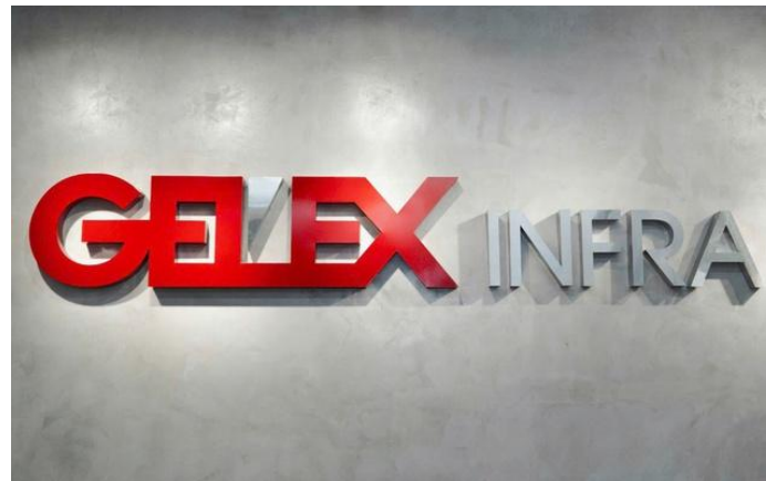
Logo CTCP Hạ tầng GELEX (HOSE: GEL)

Kế hoạch lợi nhuận giảm mạnh cho thấy GEL đang ưu tiên mở rộng đầu tư và chấp nhận áp lực lợi nhuận ngắn hạn để gia tăng quỹ tài sản hạ tầng chiến lược. Việc chuyển vốn IPO từ trả nợ sang đầu tư sân bay Gia Bình cho thấy doanh nghiệp đang ưu tiên mở rộng quy mô tài sản hạ tầng thay vì tối ưu lợi nhuận ngắn hạn.