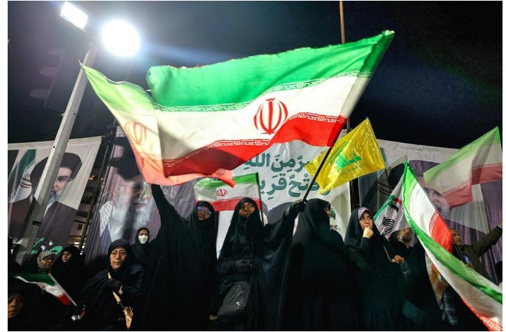
Người dân Iran vẫy quốc kỳ để ủng hộ Lãnh tụ tối cao Mojtaba Khamenei tại thủ đô Tehran

Thông tin về dự thảo thỏa thuận là tín hiệu hạ nhiệt đáng chú ý đối với thị trường năng lượng và logistics toàn cầu. Sáng nay, giá dầu Brent đã giảm xuống 94 USD/thùng – mức thấp nhất trong 5 tuần qua. Tuy nhiên, khả năng cao thị trường vẫn sẽ duy trì trạng thái thận trọng do thỏa thuận mới chỉ ở cấp độ khung không chính thức và còn phụ thuộc vào cơ chế xác minh cũng như cam kết thực thi từ cả hai phía. Rủi ro đổ vỡ đàm phán hoặc tái leo thang quân sự vẫn hiện hữu.