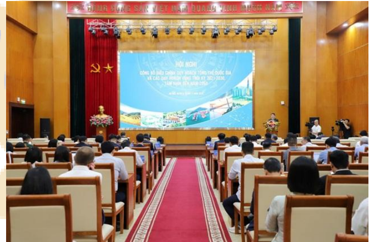
Hội nghị công bố điều chỉnh Quy hoạch tổng thể quốc gia và các quy hoạch vùng thời kỳ 2021-2030, tầm nhìn đến năm 2050

Thông tin mang tính tích cực về dài hạn khi quy hoạch mới cho thấy định hướng đẩy mạnh đầu tư hạ tầng, công nghiệp công nghệ cao và liên kết vùng rõ ràng hơn. Các nhóm hưởng lợi trực tiếp gồm xây dựng hạ tầng, khu công nghiệp, logistics, cảng biển và vật liệu xây dựng. Việc đặt mục tiêu tăng trưởng GDP trên 10% phản ánh định hướng thúc đẩy tăng trưởng mạnh hơn trong giai đoạn tới.