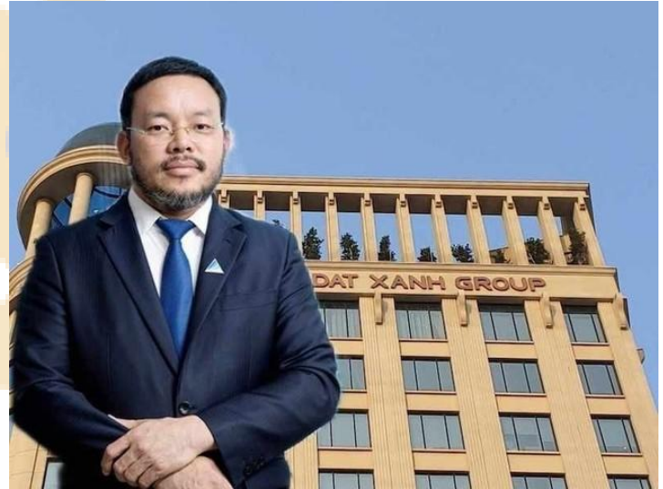
Ảnh: Chủ tịch DXG

Việc đổi tên cho thấy DXG đang chuyển hướng từ mô hình phát triển dự án sang tập trung quản lý và khai thác tài sản để tạo dòng tiền ổn định hơn. Đây là bước đi phù hợp trong bối cảnh quỹ đất mới có chi phí đến bù cao. Tuy nhiên, hiệu quả sẽ phụ thuộc vào khả năng triển khai tài sản tạo dòng tiền trong các năm tới.