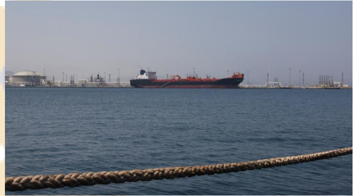
Tàu chở dầu/hóa chất "Bald Man" tại cảng Fujairah, trong bối cảnh xung đột Mỹ-Israel với Iran hạn chế giao thông hàng hải ở eo biển Hormuz, tại Fujairah, Các Tiểu vương quốc Ả Rập Thống nhất, ngày 6 tháng 5 năm 2026.

Diễn biến hiện tại cho thấy thị trường dầu vẫn trong trạng thái nhạy cảm cao với rủi ro địa chính trị. Dù kỳ vọng đàm phán Mỹ - Iran giúp hạ nhiệt giá dầu trong ngắn hạn, nguồn cung thực tế khó phục hồi nhanh do hạn chế về hạ tầng và logistics... Biến động mạnh theo tin tức đàm phán và khả năng gián đoạn mới tại Hormuz vẫn là rủi ro lớn với thị trường năng lượng toàn cầu.