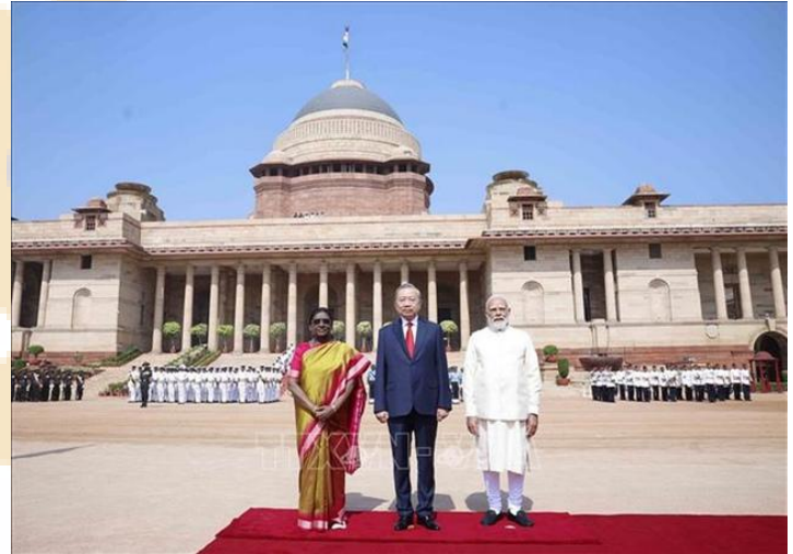
Tổng thống Droupadi Murmu và Thủ tướng Narendra Modi đồng chủ trì Lễ đón trong thể Tổng Bí thư, Chủ tịch nước Tô Lâm thăm cấp Nhà nước tới Cộng hòa Ấn Độ

Chuyến thăm cho thấy tư duy đối ngoại của Việt Nam đang dịch chuyển mạnh sang "ngoại giao phát triển", trong đó công nghệ, đổi mới sáng tạo và kết nối chuỗi giá trị trở thành trọng tâm chiến lược. Điểm đáng chú ý là Việt Nam đang chủ động tiếp cận các trung tâm công nghệ mới của châu Á thay vì chỉ tập trung vào các đối tác truyền thống. Trung hạn, việc hợp tác với Ấn Độ có thể giúp nước ta mở thêm dư địa về AI, bán dẫn, nhân lực số và công nghệ cao.