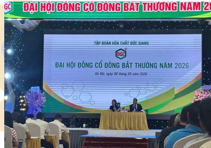
ĐHĐCĐ bất thường 2026 của DGC tại sáng ngày 08/05

DGC bước đầu ổn định bộ máy quản trị và phát tín hiệu bảo vệ lợi ích cổ đông sau biến cố pháp lý. Điểm tích cực là hoạt động sản xuất và nguồn nguyên liệu chưa bị gián đoạn, đồng thời công ty vẫn duy trì định hướng tập trung hóa chất cốt lõi. Tuy nhiên, áp lực lớn vẫn nằm ở rủi ro pháp lý chưa có kết luận cuối cùng, khả năng chi phí nguyên liệu tăng làm co hẹp biên lợi nhuận và tâm lý thận trọng của dòng tiền đối với cổ phiếu trong ngắn hạn.