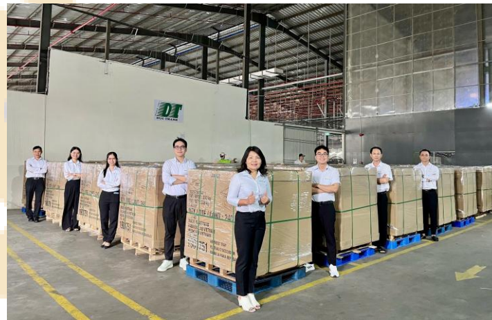
Đội ngũ phụ trách xuất khẩu GDT xuất lô hàng đầu tiên xuất cho Costco, khách hàng lớn nhất, và khó tính nhất ở Mỹ

Kế hoạch 2026 của GDT phản ánh quan điểm điều hành thận trọng dù nền lợi nhuận hiện vẫn duy trì tích cực. Điểm đáng chú ý là chất lượng tăng trưởng cải thiện nhờ tối ưu chi phí và năng suất thay vì phụ thuộc mở rộng sản lượng. Việc duy trì biên lợi nhuận cao trong bối cảnh giá đầu vào tăng cho thấy năng lực vận hành tương đối tốt. Trung hạn, động lực tăng trưởng đến từ mở rộng đơn hàng xuất khẩu và đầu tư thêm tài sản sản xuất. Tuy nhiên, áp lực nguyên liệu và khả năng duy trì nhu cầu tiêu dùng tại Mỹ vẫn là rủi ro cần theo dõi.