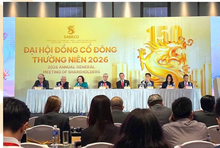
Ban lãnh đạo Sabeco trả lời câu hỏi của cổ đông tại Đại hội.

Thông tin tích cực nhẹ khi SAB tiếp tục duy trì chính sách cổ tức tiền mặt cao và lợi nhuận quý 1 phục hồi mạnh. Tuy nhiên, chất lượng tăng trưởng chưa hoàn toàn bền vững do hưởng lợi từ nền thấp và chưa phản ánh đầy đủ áp lực chi phí đầu vào. Trong trung hạn, biên lợi nhuận của SAB sẽ phụ thuộc lớn vào diễn biến giá nguyên liệu và khả năng chuyển chi phí sang giá bán trong bối cảnh sức tiêu dùng bia chịu áp lực từ thuế TTĐB và cạnh tranh ngành ngày càng gay gắt.