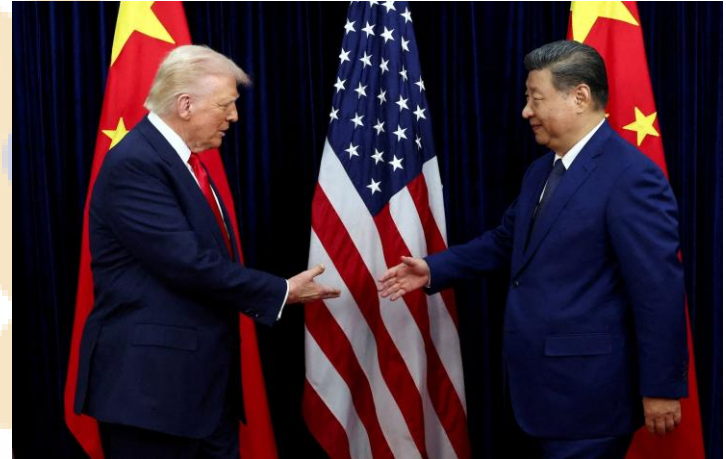
Tổng thống Mỹ Donald Trump bắt tay với Chủ tịch Trung Quốc Tập Cận Bình trong cuộc gặp song phương tại sân bay quốc tế Gimhae, bên lề Hội nghị thượng đỉnh Hợp tác kinh tế châu Á - Thái Bình Dương (APEC), ở Busan, Hàn Quốc, ngày 30 tháng 10 năm 2025.

Cuộc gặp giữa 2 nhà lãnh đạo mang ý nghĩa ổn định kỳ vọng hơn là tạo đột phá chính sách trong ngắn hạn. Điểm tích cực là hai bên duy trì đối thoại ở cả thương mại, AI và địa chính trị, giúp giảm rủi ro leo thang căng thẳng ngay trước chu kỳ bầu cử và bất ổn Trung Đông. Nếu thỏa thuận đất hiếm được gia hạn và Trung Quốc tăng mua hàng hóa Mỹ, áp lực lên chuỗi cung ứng toàn cầu có thể hạ nhiệt phần nào. Tuy nhiên, các vấn đề cốt lõi như Đài Loan, công nghệ và kiểm soát xuất khẩu vẫn là rủi ro dài hạn khó giải quyết.