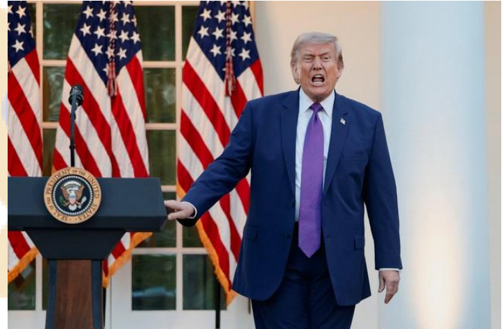
Tổng thống Mỹ Donald Trump phản ứng sau khi phát biểu tại Nhà Trắng ngày 11.5.2026

Rủi ro địa chính trị tại Trung Đông tiếp tục leo thang dù lệnh ngừng bắn chưa chính thức gỡ bỏ. Tâm lý nhà đầu tư có thể quay lại quan tâm tin tức chiến sự khi thị trường bước vào giai đoạn trống thông tin. Chúng tôi duy trì quan điểm, chỉ khi giá dầu vượt ra khỏi biên 90–120 USD/thùng, thị trường mới có phản ứng rõ rệt.