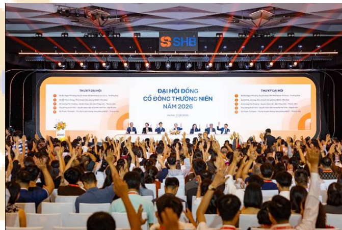
DHĐCĐ thường niên năm 2026 SHB

Kết quả quý 1 của Ngân hàng TMCP Sài Gòn – Hà Nội nhìn chung tích cực, với điểm nhấn đến từ tăng trưởng mạnh của thu nhập dịch vụ và nền tảng vốn tiếp tục được củng cố. Chất lượng tăng trưởng cải thiện khi nguồn thu ngoài lãi đóng góp lớn hơn trong cơ cấu lợi nhuận. Trong thời gian tới, động lực chính của SHB sẽ đến từ tăng vốn, mở rộng hệ sinh thái khách hàng và tăng trưởng dịch vụ. Rủi ro cần theo dõi nằm ở chất lượng tài sản và dư địa tăng trưởng tín dụng của toàn ngành.