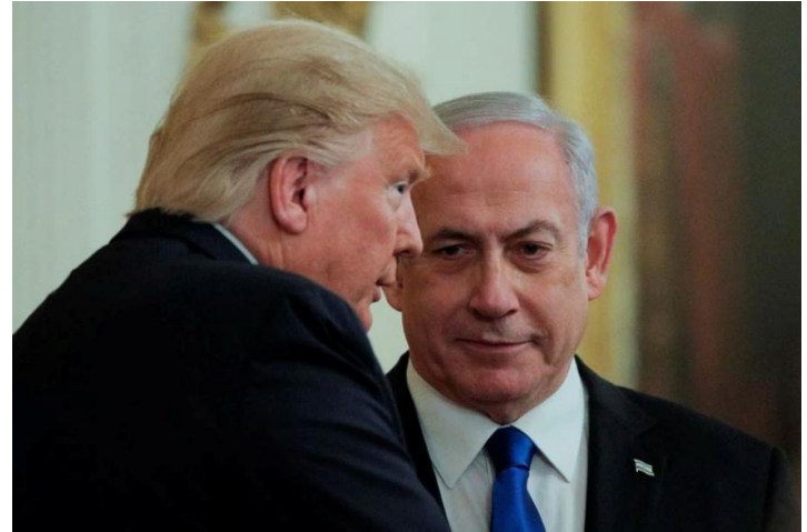
Tổng thống Mỹ Donald Trump và Thủ tướng Israel Benjamin Netanyahu.

Giá dầu vẫn chưa hình thành xu hướng tăng hoặc giảm rõ ràng do triển vọng đàm phán Mỹ-Iran liên tục thay đổi. Chúng tôi cho rằng, giá dầu dao động trong biên độ 90-120 USD/thùng sẽ không tác động tới tâm lý thị trường. Ngược lại, khi giá dầu vượt khỏi biên độ này sẽ tác động tới thị trường theo 2 hướng.