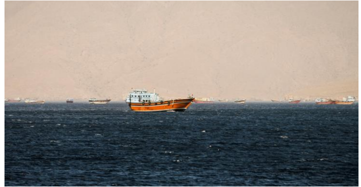
Tàu thuyền tại eo biển Hormuz.

Giá dầu vẫn chưa hình thành xu hướng tăng hoặc giảm rõ ràng do triển vọng đàm phán Mỹ-Iran liên tục thay đổi. Chúng tôi cho rằng, giá dầu dao động trong biên độ 90-120 USD/thùng sẽ không tác động tới tâm lý thị trường. Ngược lại, khi giá dầu vượt khỏi biên độ này sẽ tác động tới thị trường theo 2 hướng.