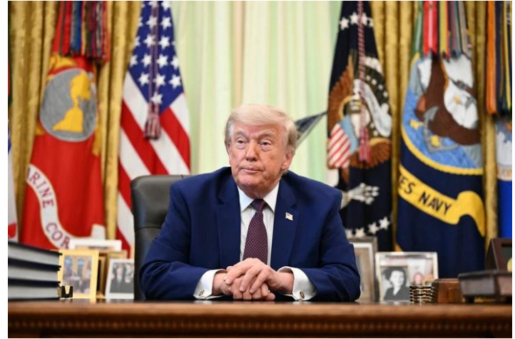
Tổng thống Mỹ Donald Trump phát biểu trước báo giới tại Phòng Bầu dục ở Nhà Trắng ngày 3-6

Diễn biến cho thấy áp lực chính trị gia tăng đối với chính sách Iran của chính quyền Tổng thống Trump, dù chưa tạo ra thay đổi pháp lý ngay lập tức do thiếu sự đồng thuận tại Thượng viện. Ngắn hạn, tác động chủ yếu mang tính tâm lý và truyền thông hơn là thay đổi thực thi chính sách. Trong trung hạn, mức độ chia rẽ nội bộ đảng Cộng hòa có thể làm giảm dư địa điều hành của Nhà Trắng trong các vấn đề xung đột quốc tế.