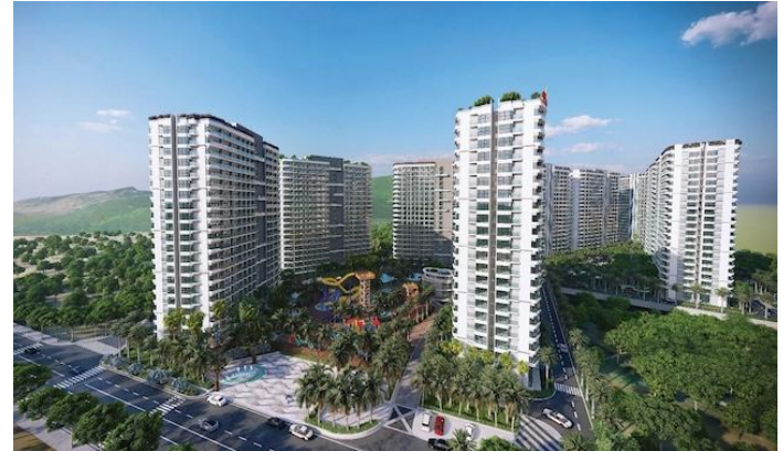
Phối cảnh Serenity Phước Hải - Ảnh: PDR

Động thái thoái 99.34% vốn tại Serenity phản ánh định hướng tái cấu trúc danh mục và tối ưu hóa nguồn lực của PDR trong bối cảnh triển khai dự án quy mô lớn còn phụ thuộc tiến độ pháp lý và hấp thụ thị trường. Việc ghi nhận thoái vốn với giá không thấp hơn giá vốn giúp hạn chế rủi ro lỗ tài chính, nhưng mức độ đóng góp lợi nhuận tương lai từ dự án sẽ chuyển sang bên nhận chuyển nhượng.