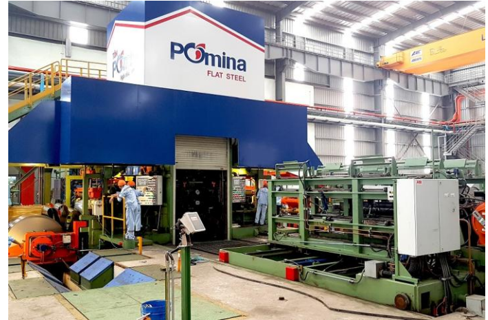
Ảnh: Dây chuyền thép cán nguội Pomina

Đây chủ yếu là kế hoạch tái cơ cấu hơn là sự xác nhận về khả năng phục hồi lợi nhuận của POM. Triển vọng ngắn hạn phụ thuộc vào tốc độ khôi phục công suất, nhu cầu thép xây dựng và hiệu quả hợp tác với Vinmetal cũng như hệ sinh thái Vingroup. Rủi ro chính nằm ở khả năng thực hiện kế hoạch sản xuất, áp lực tài chính tích lũy sau nhiều năm thua lỗ và biến động của thị trường thép trong nước.