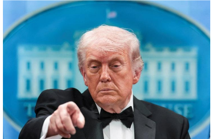
Tổng thống Mỹ Donald Trump.

Giá dầu đã giảm về mức thấp nhất trong 3 tháng sẽ hỗ trợ tâm lý thị trường trong bối cảnh thiếu vắng các thông tin về kết quả kinh doanh. Xu hướng giá dầu trong thời gian tới vẫn sẽ phụ thuộc vào diễn biến đàm phán giữa Mỹ và Iran.