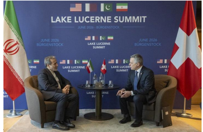
Ảnh: Ngoại trưởng Thụy Sĩ Ignazio Cassis đã chào đón người đồng cấp Iran Abbas Araghchi đến Thụy Sĩ

Việc đàm phán từng bị hủy bỏ hôm thứ 6 trước khi được nối lại cho thấy rủi ro địa chính trị vẫn ở mức cao. Dù vậy, việc Mỹ và Iran tiếp tục duy trì đối thoại và chưa phá vỡ thỏa thuận ngừng bắn là tín hiệu tích cực, giúp giảm nguy cơ leo thang xung đột trong ngắn hạn. Giá dầu hiện duy trì quanh ngưỡng 80 USD/thùng nhìn chung ảnh hưởng trung tính đối với tâm lý thị trường.