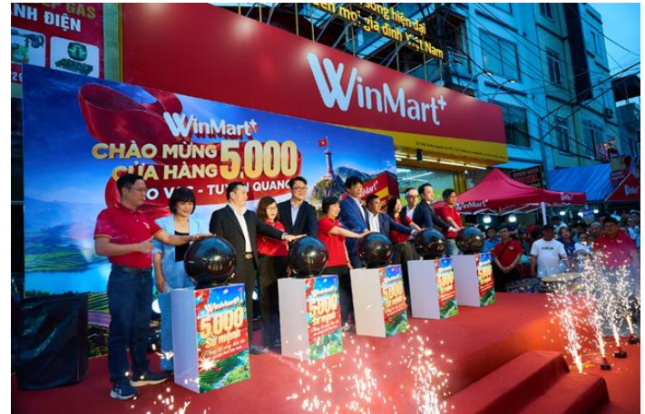
WinMart+ cán mốc 5,000 cửa hàng toàn quốc

Cột mốc 5,000 cửa hàng cho thấy WinCommerce đã chuyển từ giai đoạn mở rộng sang tối ưu hiệu quả vận hành, thể hiện qua việc chi phí trên mỗi cửa hàng giảm 30% và mục tiêu lợi nhuận 1,000 tỷ đồng. Trong trung hạn, động lực tăng trưởng tiếp tục đến từ khu vực nông thôn khi độ phủ còn thấp và tỷ lệ bán lẻ hiện đại tại Việt Nam vẫn ở mức khiêm tốn. Rủi ro chính nằm ở tốc độ mở rộng quá nhanh có thể gây áp lực lên hiệu quả từng điểm bán và chi phí vận hành trong ngắn hạn.