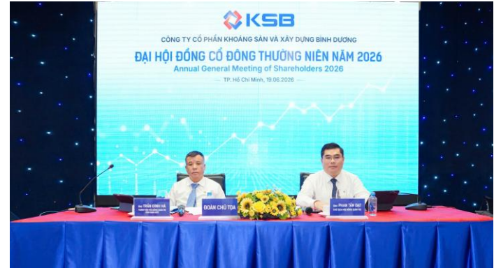
CTCP Khoáng sản và Xây dựng Bình Dương (HOSE: KSB) tổ chức ĐHĐCĐ thường niên 2026 sáng ngày 19/06

Đánh giá tích cực khi KSB đã hoàn thành khoảng 65% kế hoạch lợi nhuận năm chỉ sau nửa đầu 2026, phản ánh sự cải thiện từ mảng đá xây dựng. Triển vọng trung hạn được hỗ trợ bởi nhu cầu vật liệu cho các dự án hạ tầng lớn và dư địa phát triển từ hai KCN Đất Cuộc, Hoa Lư. Rủi ro chính nằm ở tiến độ pháp lý, giải phóng mặt bằng và áp lực huy động vốn cho các dự án KCN quy mô lớn.