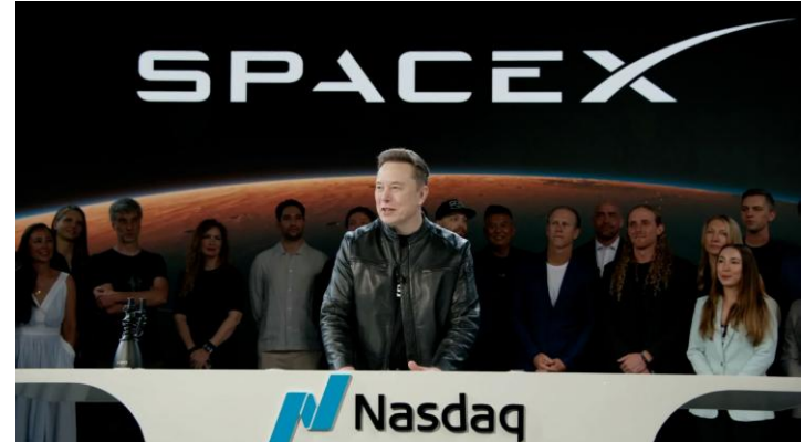
Ông Elon Musk, nhà sáng lập SpaceX, sau đợt phát hành cổ phiếu lần đầu ra công chúng (IPO) của công ty tại sàn giao dịch Nasdaq ở New York vào ngày 12 tháng 6 năm 2026.

Sự kiện IPO SpaceX mang ý nghĩa lịch sử khi cho thấy nhu cầu rất lớn của nhà đầu tư đối với các doanh nghiệp đi đầu trong cuộc cách mạng về hệ sinh thái không gian, AI và viễn thông, bất chấp việc công ty vẫn đang thua lỗ. Diễn biến tăng giá ngay sau niêm yết cho thấy thị trường đang định giá SpaceX dựa trên tiềm năng dài hạn hơn là lợi nhuận hiện tại.