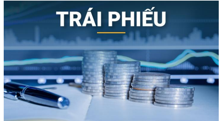
Ảnh: Minh họa

MBS đang chủ động tối ưu cơ cấu nguồn vốn sau khi hoàn tất đợt tăng vốn hơn 3,300 tỷ đồng. Đây là tín hiệu tích cực về thanh khoản và năng lực huy động vốn của công ty. Triển vọng ngắn hạn phụ thuộc vào nhu cầu vay margin và thanh khoản thị trường. Việc bổ sung hơn 2,300 tỷ đồng cho vay ký quỹ có thể giúp MBS tăng trưởng lợi nhuận từ quý 2.