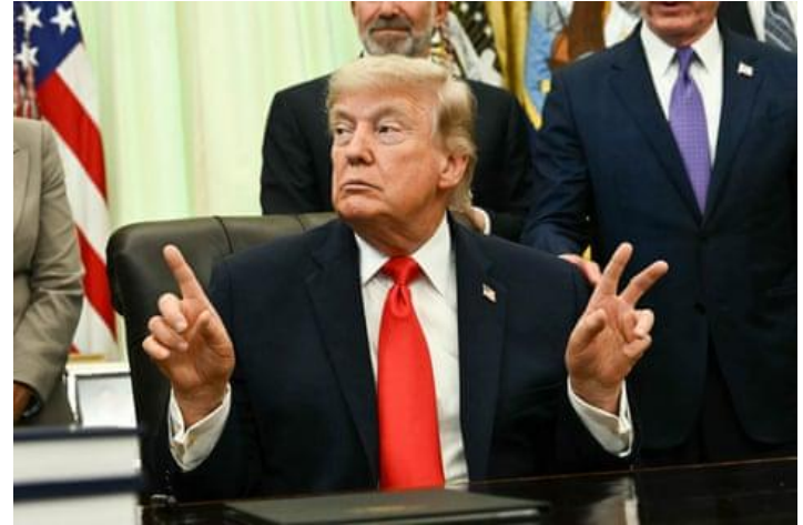
Tổng thống Donald Trump.

Đây là thông tin tích cực với thị trường tài chính toàn cầu. Hiện tại, giá dầu Brent đã giảm xuống 84 USD/thùng, thấp nhất kể từ đầu tháng 3/2026 và xóa bỏ phần lớn mức tăng do xung đột địa chính trị trước đó. Chúng tôi cho rằng, thỏa thuận chính thức này sẽ đánh dấu bước chuyển mới của cuộc xung đột. Trong bối cảnh thị trường trong nước đang thiếu vắng các thông tin hỗ trợ mới, diễn biến này có thể tạo tác động tích cực đến tâm lý giao dịch tuần này. Rủi ro thỏa thuận bị trì hoãn vẫn hiện hữu.