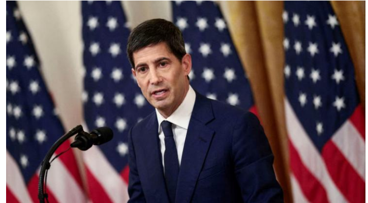
Ảnh: Chủ tịch FED Kevin Warsh

Thị trường không kỳ vọng Fed thay đổi lãi suất, nhưng cuộc họp đầu tiên của ông Kevin Warsh có ý nghĩa lớn trong việc định hình uy tín và định hướng chính sách của Fed. Yếu tố quan trọng nhất là ngôn từ trong thông cáo và họp báo, thay vì quyết định lãi suất. Trong ngắn hạn, nếu Fed loại bỏ thiên hướng nới lỏng hoặc nhấn mạnh rủi ro lạm phát, USD và lợi suất trái phiếu Mỹ có thể tiếp tục được hỗ trợ. Ngược lại, bất kỳ tín hiệu mềm mỏng nào trước áp lực từ Nhà Trắng có thể làm gia tăng lo ngại về tính độc lập của Fed và khiến kỳ vọng lạm phát mất neo.