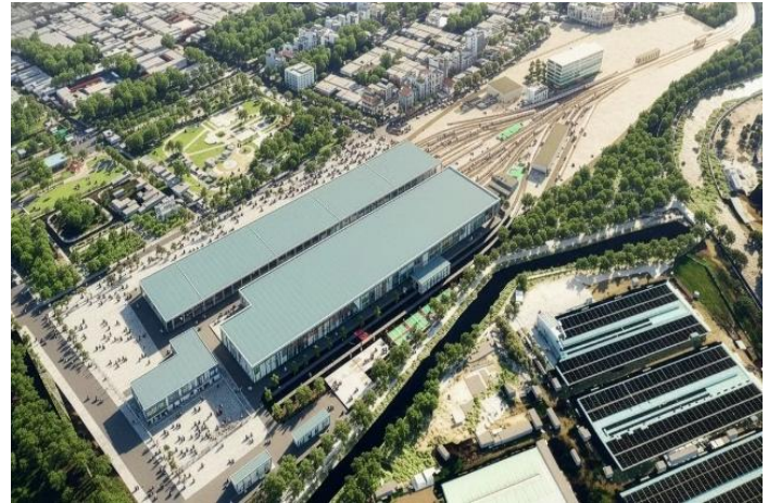
Phối cảnh khu vực depot của tuyến metro số 2 ở TPHCM.

Thông tin mang tính tích cực dài hạn đối với thị trường bất động sản TP.HCM và nhóm doanh nghiệp sở hữu quỹ đất gần các tuyến metro. Mô hình TOD giúp gia tăng giá trị đất đai, tạo nguồn thu ngân sách và thúc đẩy phát triển hạ tầng đồng bộ. Tuy nhiên, tác động đến kết quả kinh doanh doanh nghiệp sẽ cần thêm thời gian do các dự án vẫn đang ở giai đoạn quy hoạch và chuẩn bị triển khai. Các doanh nghiệp có quỹ đất lớn tại khu vực Tây Bắc TP.HCM, Tân Bình, Tân Phú và Thủ Đức sẽ là nhóm hưởng lợi đáng chú ý trong trung và dài hạn.