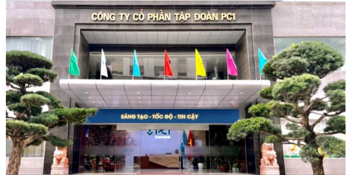
Ảnh: Trụ sở PC1

Thông tin tích cực khi CII tiếp tục mở rộng danh mục đầu tư thông qua việc gia tăng sở hữu tại PC1, phản ánh định hướng tăng tỷ trọng ở lĩnh vực hạ tầng và năng lượng. Quy mô giao dịch khoảng 190 tỷ đồng không lớn so với nguồn vốn 2,500 tỷ đồng vừa huy động từ trái phiếu chuyển đổi, cho thấy CII vẫn còn dư địa triển khai các khoản đầu tư khác. Mục tiêu đầu tư và khả năng tiếp tục nâng tỷ lệ sở hữu tại PC1 sẽ là yếu tố cần theo dõi trong thời gian tới.