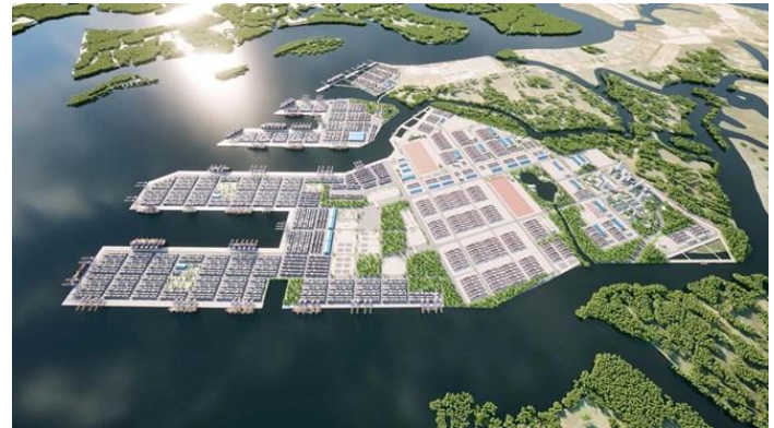
Phối cảnh dự án cảng tổng hợp và container Cái Mép Hạ.

Thông tin tích cực đối với nhóm doanh nghiệp cảng biển (GMD, HAH); BĐS KCN trong khu vực (SZC). Về trung hạn, Cái Mép Hạ cùng sân bay Long Thành và các tuyến giao thông kết nối sẽ tạo động lực cho tăng trưởng xuất nhập khẩu, logistics và khu công nghiệp khu vực phía Nam. Tuy nhiên, dự án có thời gian đầu tư dài, do đó tác động lên kết quả kinh doanh của các doanh nghiệp liên quan sẽ diễn ra theo lộ trình và phụ thuộc vào tiến độ giải ngân, xây dựng cũng như khả năng thu hút nguồn hàng.