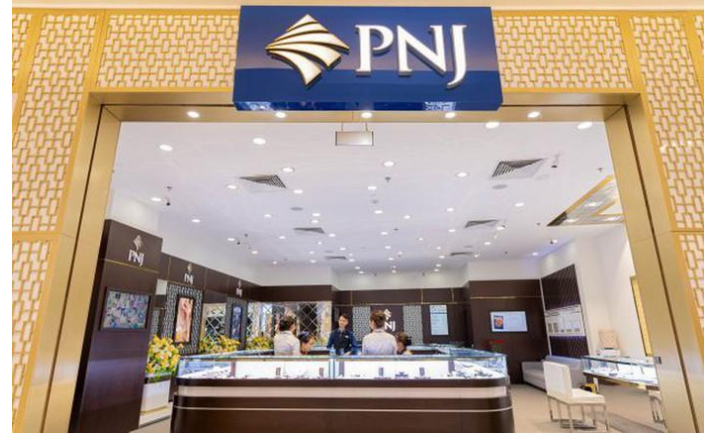
Ảnh: Cửa hàng PNJ

Thông báo của PNJ có ý nghĩa tích cực ở góc độ quản trị khủng hoảng, khi doanh nghiệp khẳng định đây là trách nhiệm của cá nhân, đồng thời cam kết phối hợp điều tra và duy trì hoạt động bình thường. Tuy nhiên, thông tin này chưa đủ để loại bỏ hoàn toàn rủi ro, bởi thị trường vẫn chờ kết quả điều tra để đánh giá liệu sai phạm chỉ dừng ở cấp cá nhân hay có liên quan đến quy trình kiểm định của P-Lab. Trong ngắn hạn, áp lực chủ yếu vẫn đến từ yếu tố tâm lý và uy tín thương hiệu hơn là tác động trực tiếp đến kết quả kinh doanh của PNJ. PNJ sẽ hợp nhà đầu tư trong hôm nay và chúng tôi sẽ cập nhật trong bản tin gần nhất.