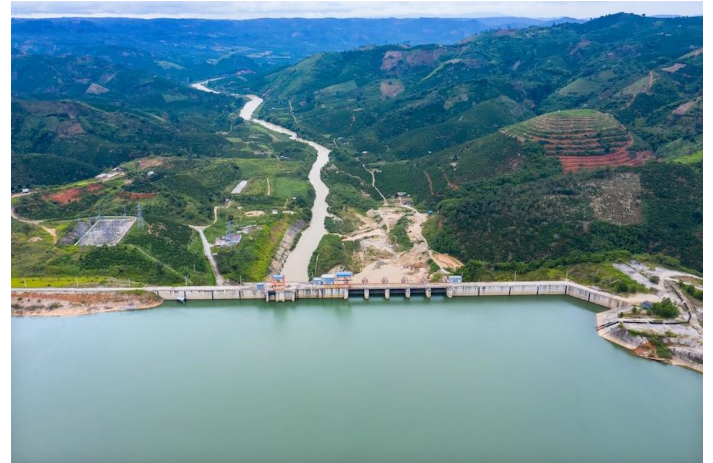
Hồ thủy điện Đồng Nai 2.

Đây là thông tin tích cực đối với Trungnam Group khi doanh nghiệp tiếp tục mở rộng danh mục năng lượng tái tạo theo Quy hoạch điện VIII điều chỉnh. Việc tận dụng hạ tầng truyền tải và đấu nối sẵn có của Thủy điện Đồng Nai 2 giúp cải thiện hiệu quả đầu tư, giảm rủi ro triển khai so với các dự án phát triển mới. Tuy nhiên, tác động tài chính sẽ chưa xuất hiện trong ngắn hạn do dự án dự kiến chỉ vận hành từ cuối năm 2027. Cổ phiếu VND có thể được hưởng lợi khi đang nắm giữ lượng lớn trái phiếu của Trung Nam.